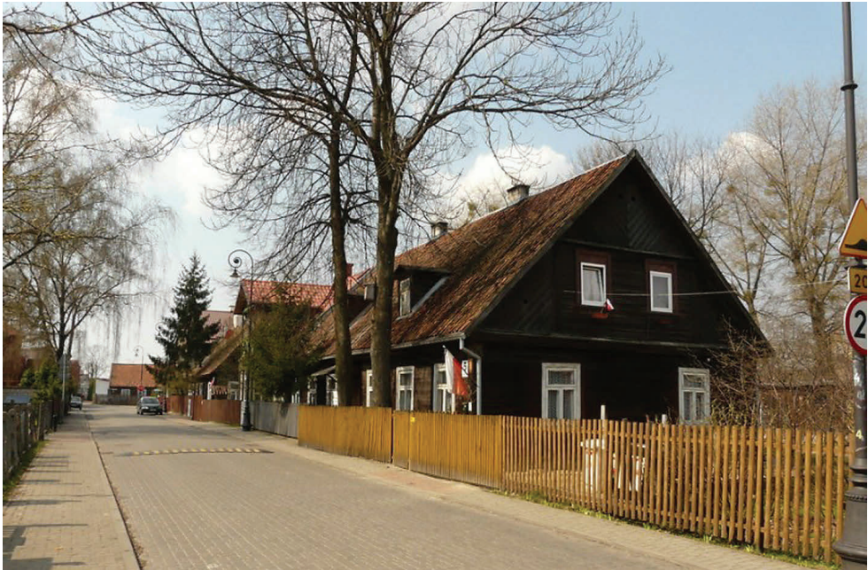
8. Fragment dzielnicy Bojary w Białymstoku, http://www.ciekawepodlasie.pl/opis/509,Bojary+-+Pozosta%C5%82o%C5%9Bci+drewnianego+Bia%C5%82egostoku.htm [dostęp: 20 VII 2023] A part of the Bojary district in Białystok, http://www.ciekawepodlasie.pl/opis/509,Bojary+-+Pozosta%C5%82o%C5%9Bci+drewnianego+Bia%C5%82egostoku.htm [access: 20 VII 2023]