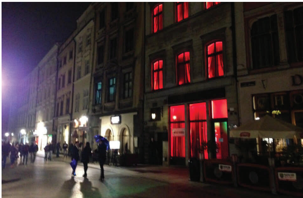
4. Klub go-go na krakowskim rynku, https://wpolityce.pl/polityka/219740-marek-lasota-krakow-powinien-i-moze-walczyć-z-klubami-typu-go-go [dostęp: 20 VII 2023]

A go-go club on the Main Square in Kraków, https://wpolityce.pl/polityka/219740-marek-lasota-krakow-powinien-i-moze-walczyć-z-klubami-typu-go-go [access: 20 VII 2023]