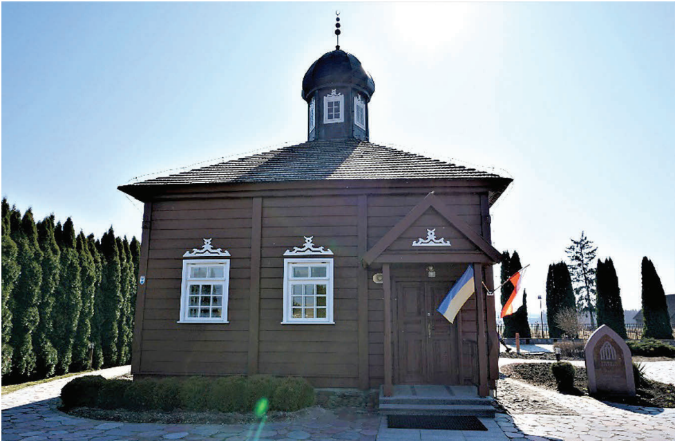
6. Meczet w Bohonikach, The Bohoniki Mosque.