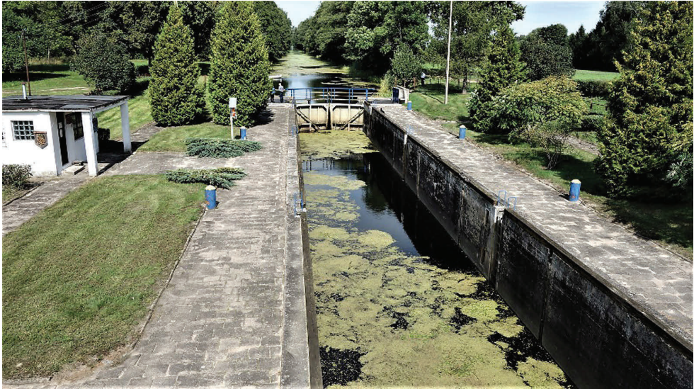
7. Śluza na kanale Augustowskim, źródło własne Wojewódzkiego Urzędu Ochrony zabytków w Białymstoku A lock on the Augustów Canal. Own materials of the Voivodeship Historic Preservation Office in Białystok